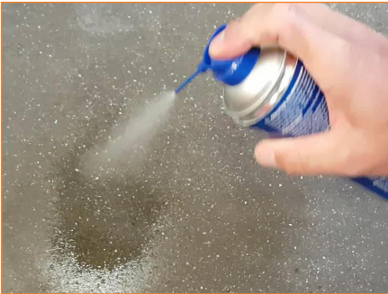
Vloer vetvrij maken